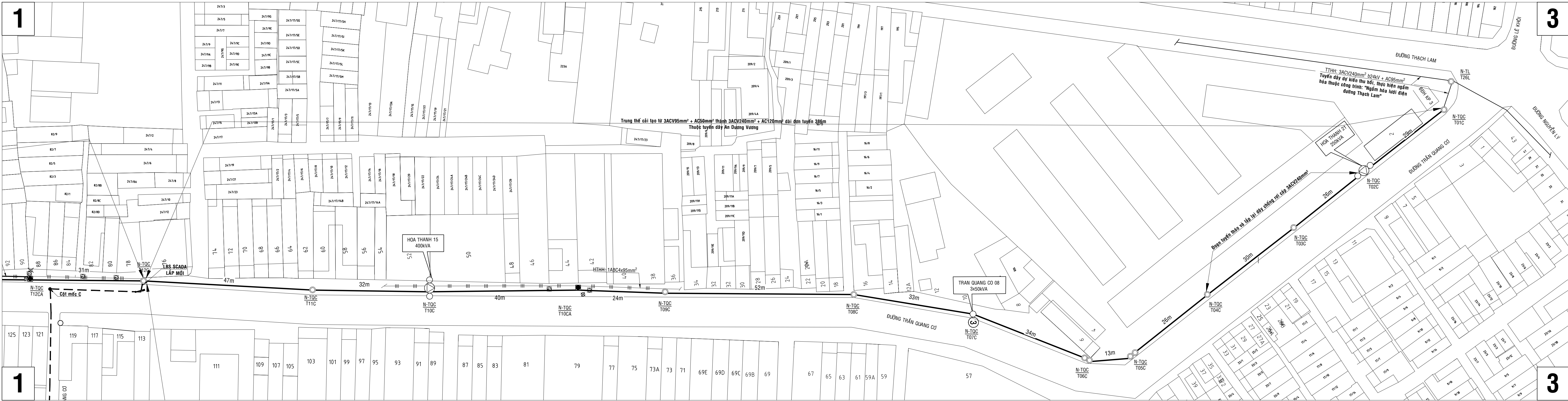
MẶT BẰNG CÀI TẠO DÂY TRUNG THỂ NỘI TRÊN TUYẾN ĐƯỜNG TRẦN QUANG CỎ