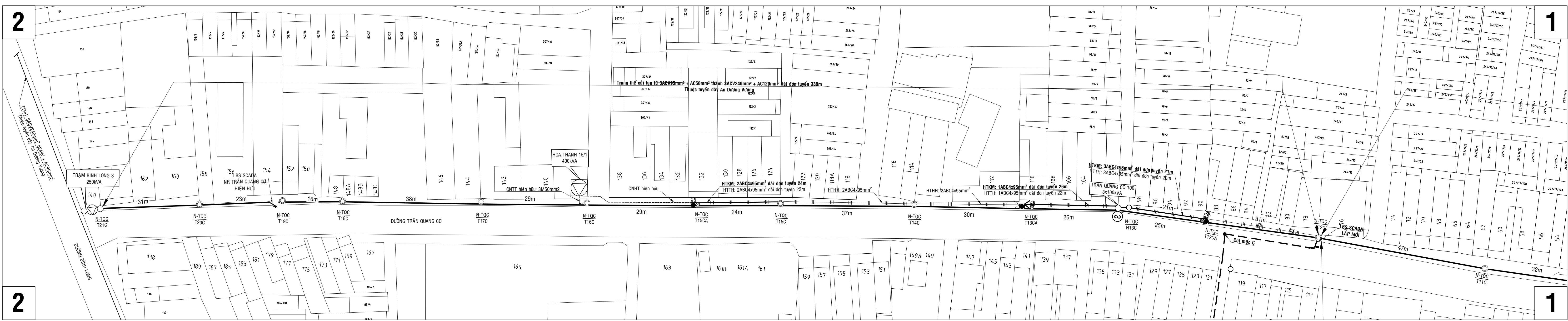
MẶT BẰNG CÀI TẠO DÂY TRUNG THỂ NỘI TRÊN TUYẾN ĐƯỜNG TRẦN QUANG CỎ